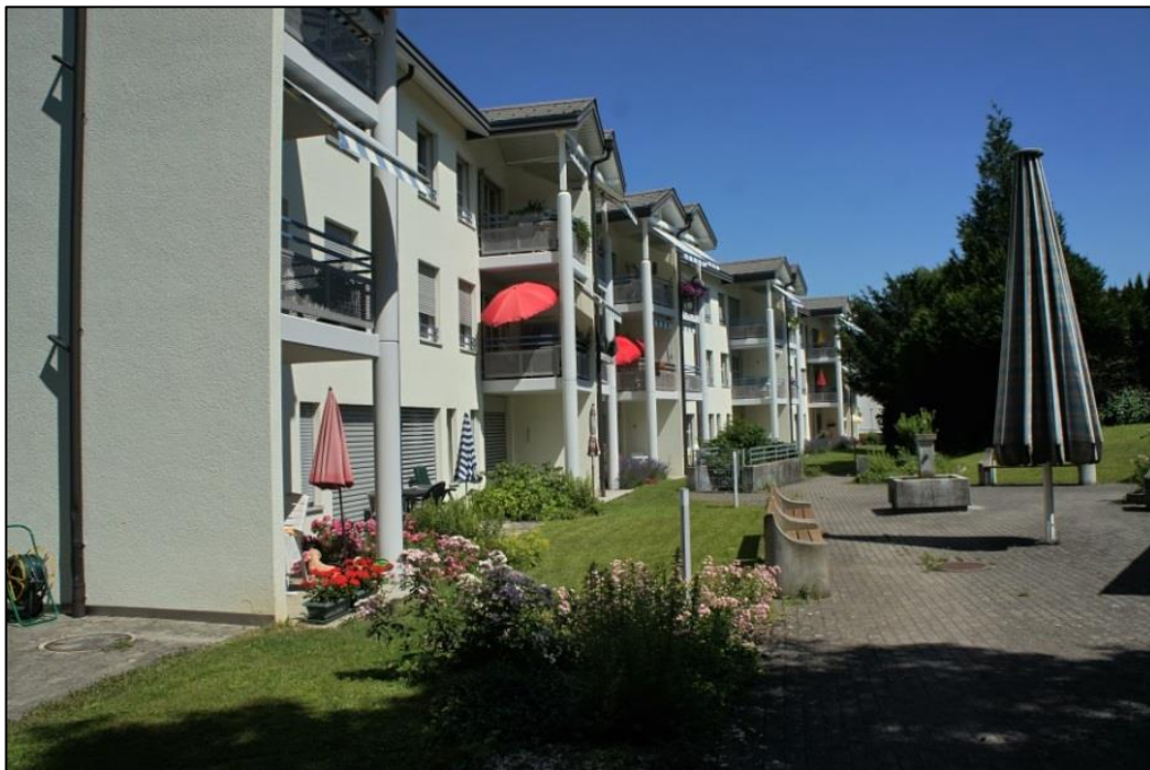
Gartenanlage Bahnhofstrasse 22