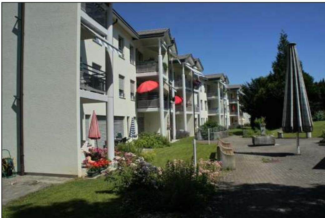
Gartenanlage Bahnhofstrasse 22